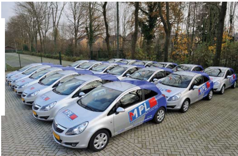
Het wagenpark van MPL

systeem is namelijk zo ontworpen, dat het geheel weer eenvoudig terug te plaatsen is. Dat betekent dat de auto's na de leaseperiode weer als gewone personenauto's in de verkoop kunnen. Een unieke oplossing, waarin we gezamenlijk met MPL geïnvesteerd hebben. Zo zie je maar. Er kan veel goeds tot stand komen als klanten en leveranciers gezamenlijk de intentie hebben daadwerkelijk invulling te geven aan milieubewuster omgaan met mobiliteit. Deze oplossing biedt perspectief voor andere bedrijfswagens. Als Broekhuis